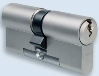
EPS-Doppelzylinder in Modulbauweise