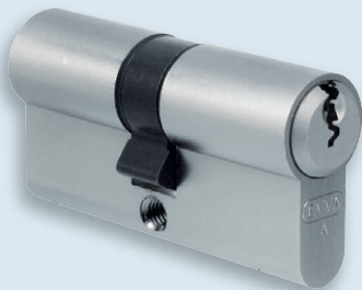
EPS-Doppelzylinder in Kompaktbauweise